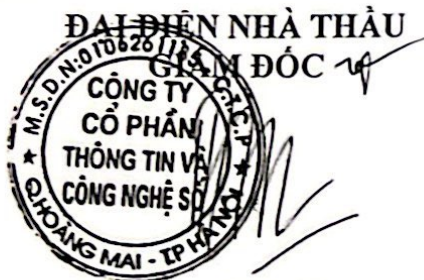
Dương Đình Hòa

Biên bản này được lập thành 04 bản có giá trị như nhau, mỗi bên giữ 02 bản để làm cơ sở thanh toán./.